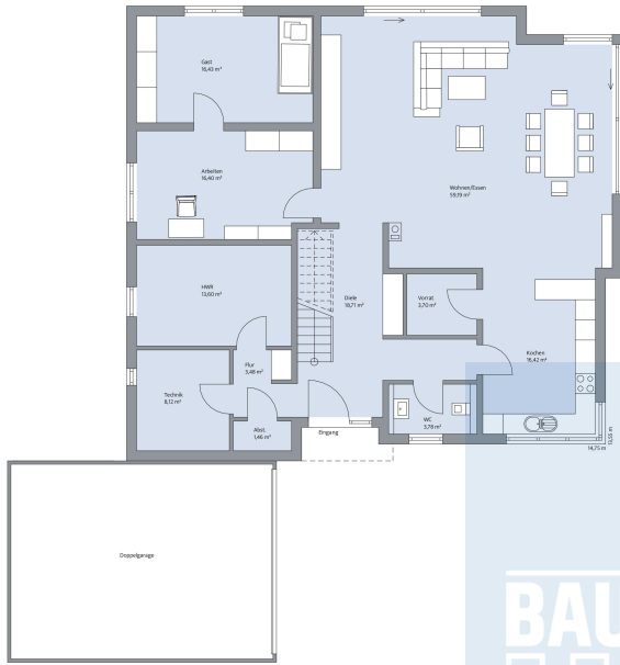
Haus Abendroth Grundriss